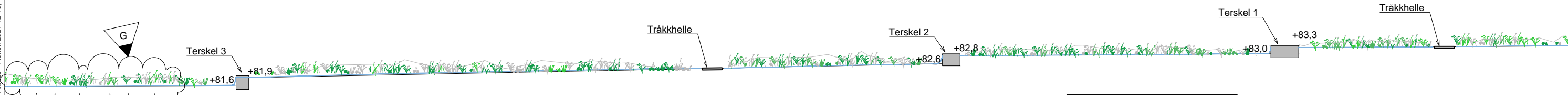
REGNBED VOLDSLØKKA SNITT A-A M=1:100 (A1)

HENVISNINGER: V301 spunt J011 Terskel 1 J012 Terskel 2 og 3 J013 Snitt gjennom regnbed og tråkkheller O201-O205 Planteplan